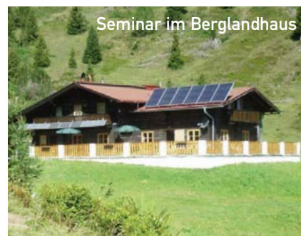
Seminar im Berglandhaus